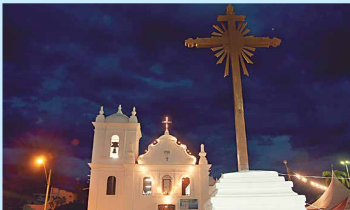
Fachada da Igreja do Rosário, que se constitui como um importante símbolo religioso do município

Segundo o secretário de Estado da Cultura, Lau Siqueira o inventário é fundamental para a preservação da memória e história da Paraíba. "No momento em que se discute com instituições como UFPB, UEPB, FCJA, Iphaep e outras instituições governamentais ou da sociedade civil, a criação de um Plano Estadual de Patrimônio e Memória, não devemos esquecer que a luta de um corpo técnico competente e comprometido, já nos