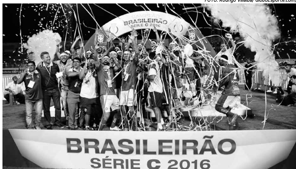
O Boa Esporte surpreendeu ao conquistar o título. O clube mineiro foi quem eliminou o Botafogo paraibano