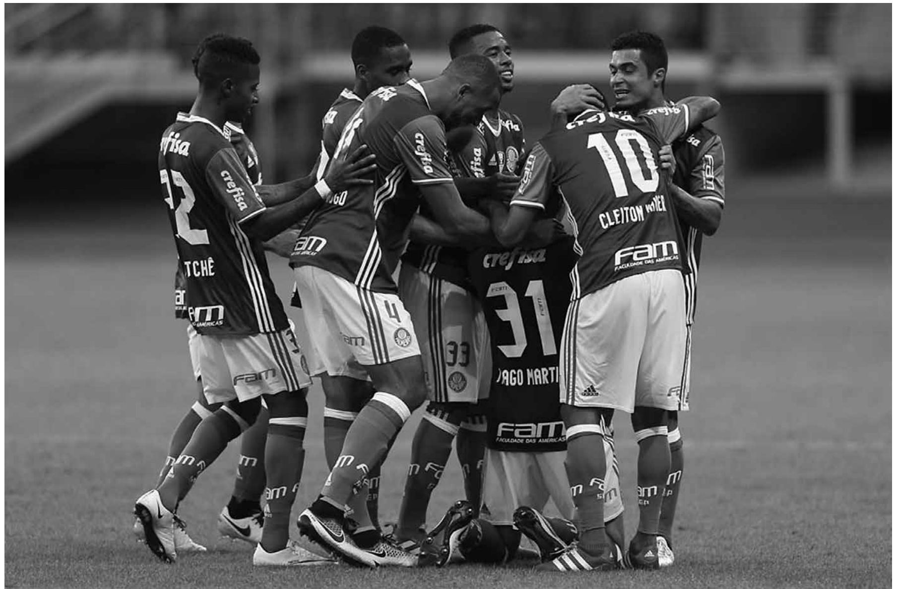
O Palmeiras conquistou com méritos o título brasileiro e com uma rodada de antecedência ao vencer a Chapecoense. Foi a sua nona consagração na competição

Na zona da degola, não resistiram Joinville, Tupi, Bragantino e Sampaio Corrêa. A situação do JEC, em especial, chama a atenção: ele