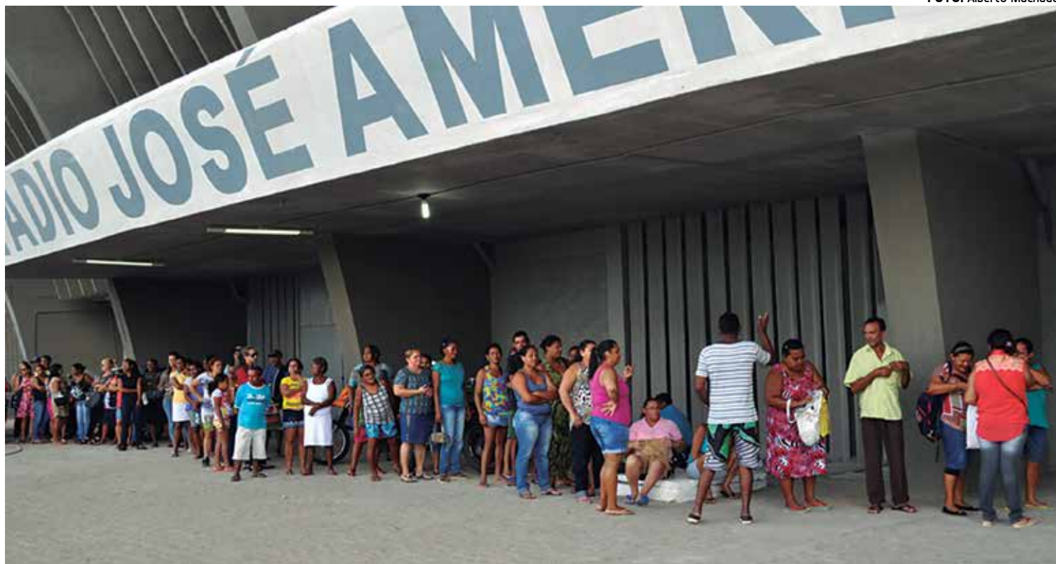
Em João Pessoa, onde a quantidade de beneficiários é maior, o pagamento está ocorrendo no Almeidão, das 8h às 17h

“Estamos aqui hoje (ontem) no Almeidão para acompanhar a operação. As pessoas agradecem a iniciativa. Eles sabem que somos o único Estado a realizar a ação, com recursos próprios em um momento de recessão econômica muito grande no País. Mas, reafirmamos o compromisso do Governo do Estado com a população que vive em situação de vulnerabilidade social