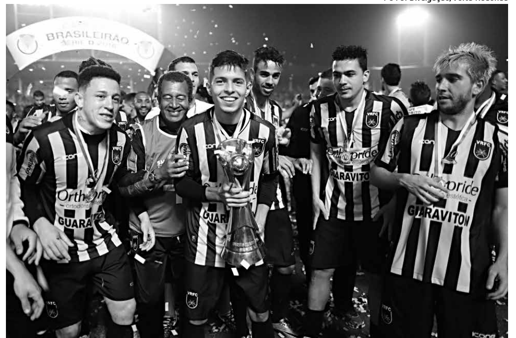
O Volta Redonda fez uma campanha impecável na Série D e está garantido na Série C