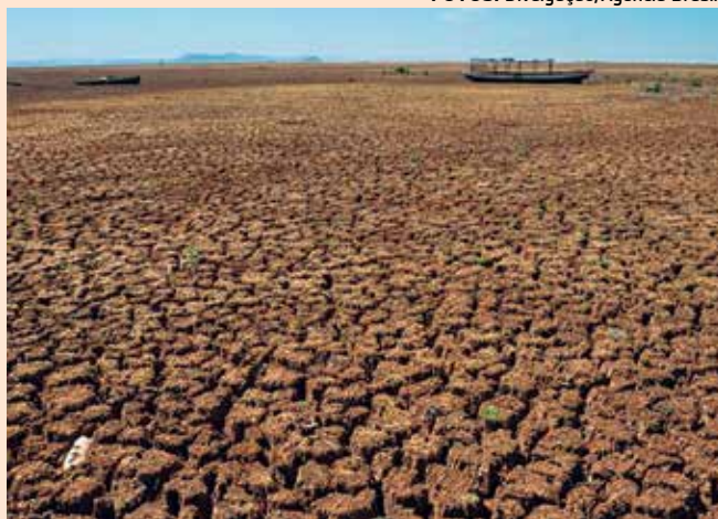
Na região Nordeste, seca provoca grande impacto social