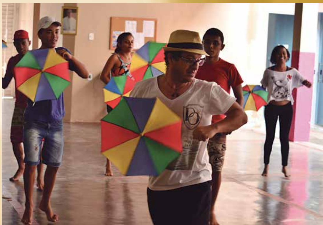
Atividades de dança e performances artísticas também fazem parte da iniciativa

“A novidade que temos nesta terceira edição é a Pré-Virada, onde pensamos em apresentar ao público assuntos que são de grande importância, levando em conta a nossa atual situação no País. Além disso, queremos trabalhar também pautas que são pouco discutidas no município como, por exemplo, o movi-