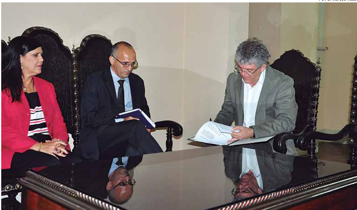
Ricardo sanciona e a Paraíba passa a ser o 3º Estado no País a criar o mecanismo, com a responsabilidade de atuar e apurar casos de tortura

O Brasil se compromete perante a Organização das Nações Unidas (ONU) de criar em cada Estado um mecanismo de combate a tortura. A Paraíba passou a ser o terceiro Estado no País - os outros dois são Rio de Janeiro e Pernambuco - a criar o mecanismo, com a responsa-