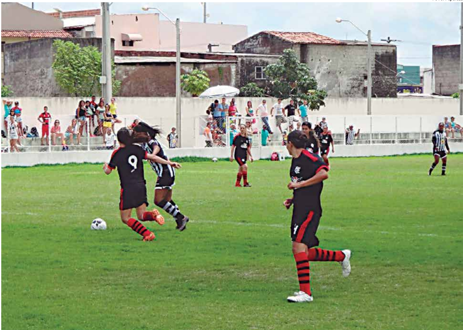
No Primeiro Turno, o Botafogo não encontrou dificuldades para vencer o Flamengo por 4 a 0, em jogo realizado no Estádio Wilsão. Hoje será no CT Ivan Thomaz

Pela tabela divulgada no último domingo pelo Departamento Técnico da Federação Paraibana de Futebol, numa forma de que o campeonato se encerre no dia 23 próximo, antes do Natal, as equipes terão que fazer três jogos em uma semana, ficando estabelecido que serão realizadas partidas hoje, na próxima sexta-feira e domingo. A fase final com jogos de ida e volta ficou determinada para a terça-feira, dia 20 e na sexta-feira, dia 23.