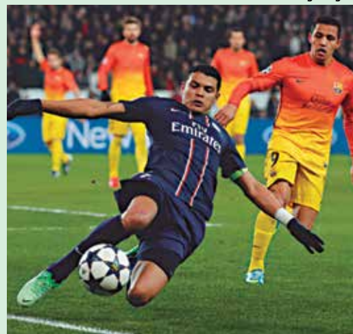
PSG e Barcelona voltam a se enfrentar na Liga

do com o levantamento estatístico do site srgooool, terá a menor diversidade de países desde a implantação do formato em 2003/2004. São apenas seis países na briga pelo título da UCL. O atual campeão Real Madrid vai encarar o italiano Napoli. Mas o grande desafio das oitavas de final será entre PSG e Barcelona.