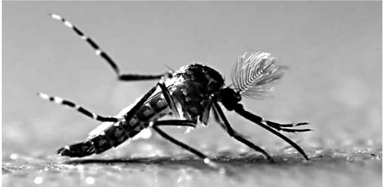
Foram notificados, ainda, 20.501 casos de chikungunya e 4.722 de zika vírus, doenças também causadas pelo Aedes aegypti

Número de registros é 66,4% maior do que o do ano passado