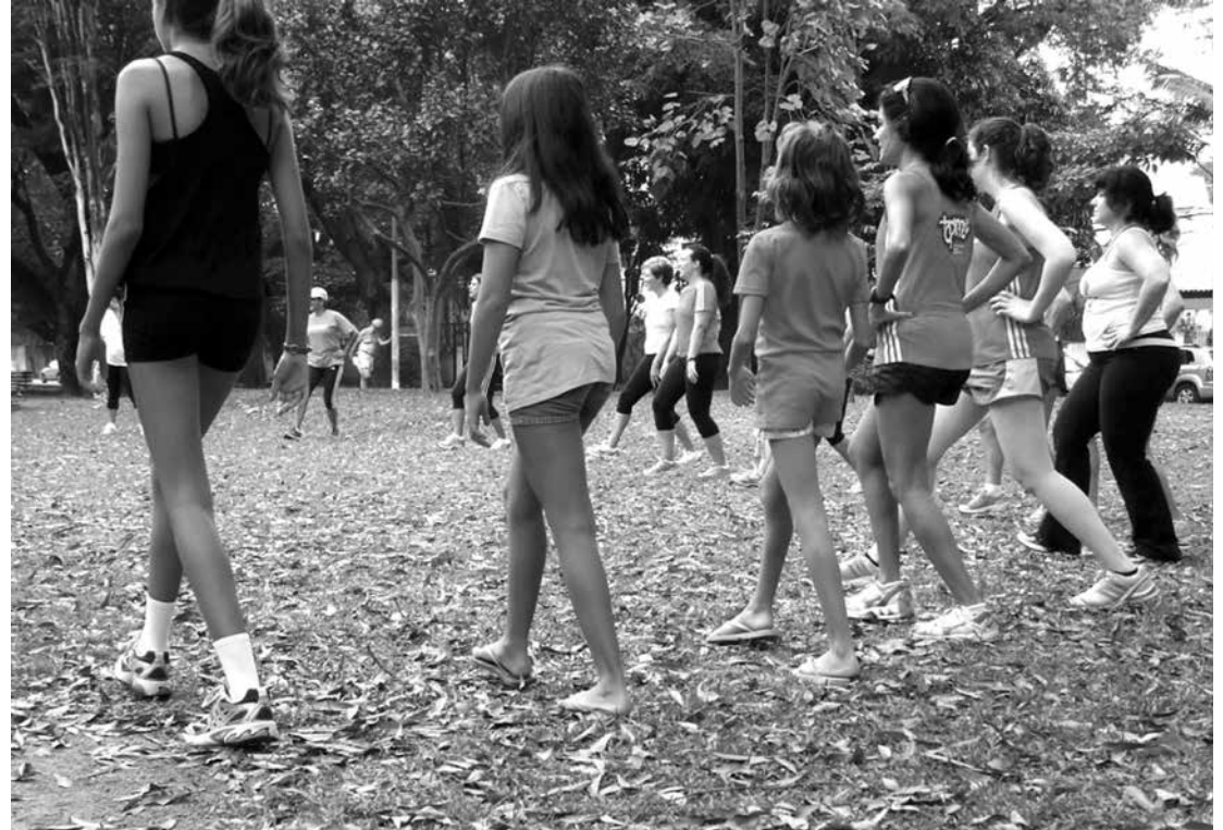
Jovens que não fazem exercícios apresentam mais cedo as doenças crônicas

Nos Estados Unidos, por exemplo, foi constatado que essa geração com até 12 anos pode ser a primeira a viver menos que os pais por conta do sedentarismo. Além disso, de acordo com uma pesquisa realizada para o Projeto Desenhado para o Movimento, a atividade física dos brasileiros terá uma redução de mais de 34% até 2030, e mais da metade deles será considerada inativa.