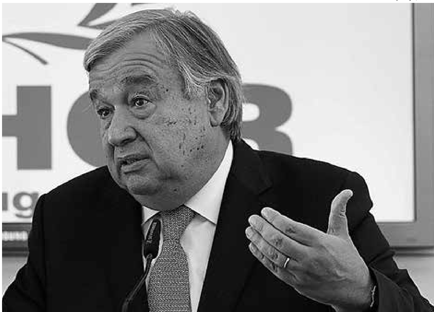
António Guterres prestou juramento e fez o seu primeiro discurso como novo secretário-geral da Organização das Nações Unidas

Na mesma mensagem, o papa destacou que as mulheres, como líderes pacifistas, fizeram grandes avanços em todo o mundo.