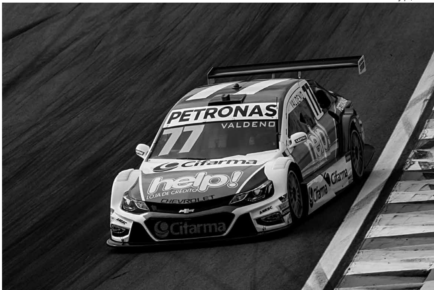
Valdeno Brito terminou a última prova do ano em nono lugar e caiu de terceiro para quarto lugar na classificação da Stock Car de 2016