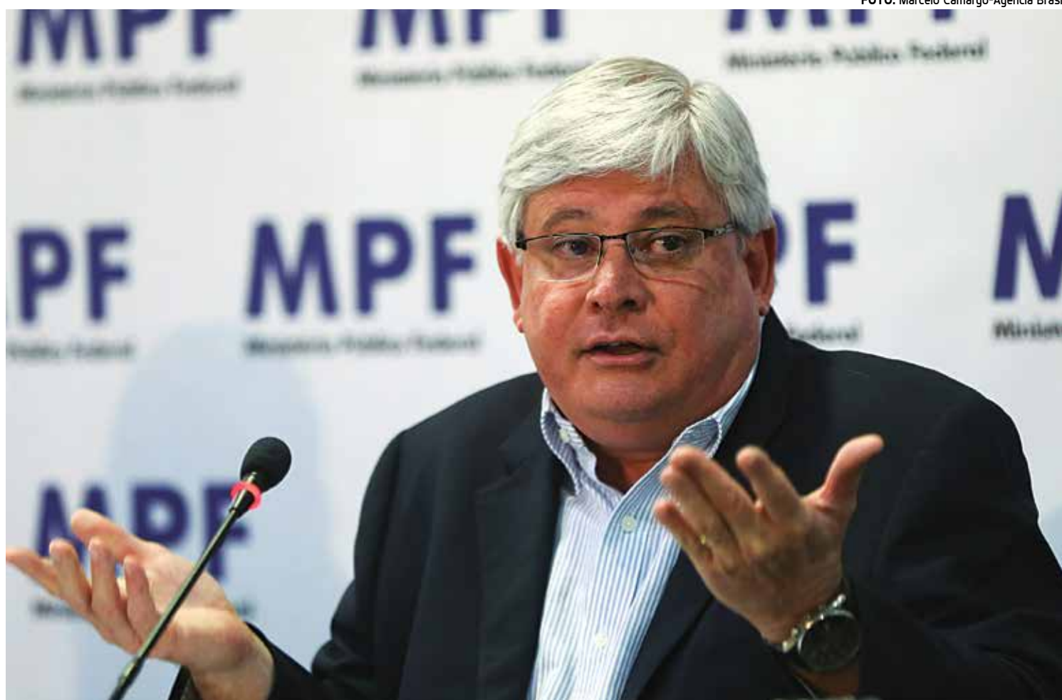
O procurador-geral da República, Rodrigo Janot, protocolou denúncia no Supremo contra o presidente do Senado, Renan Calheiros

Braga disse que, se o texto não for aprovado este ano, os gastos para a saúde serão reduzidos em R$ 9,9 bilhões. Esse valor foi acrescido pelo relator para cumprir a destinação de 15% da receita corrente líquida, conforme determinado na PEC 55.